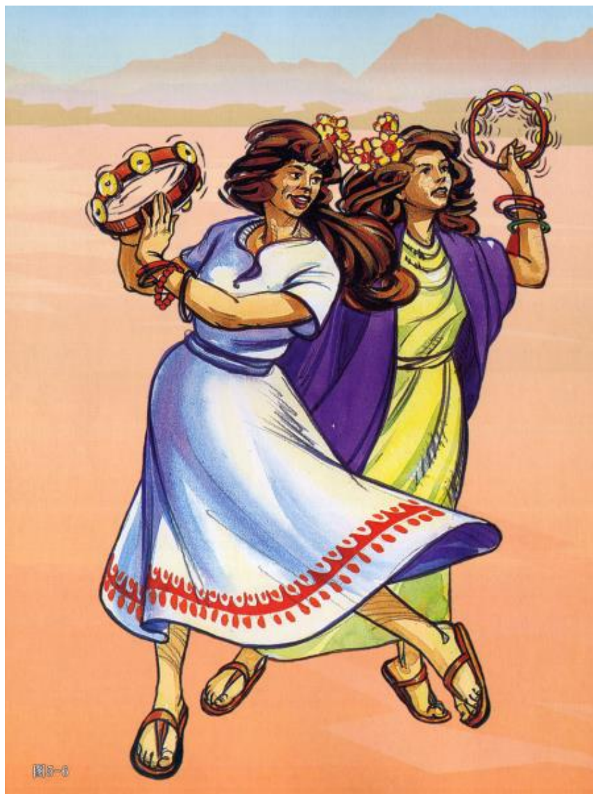
《喜乐树全人成长》第5辑第12讲：摩西（上）摩西与百姓过红海