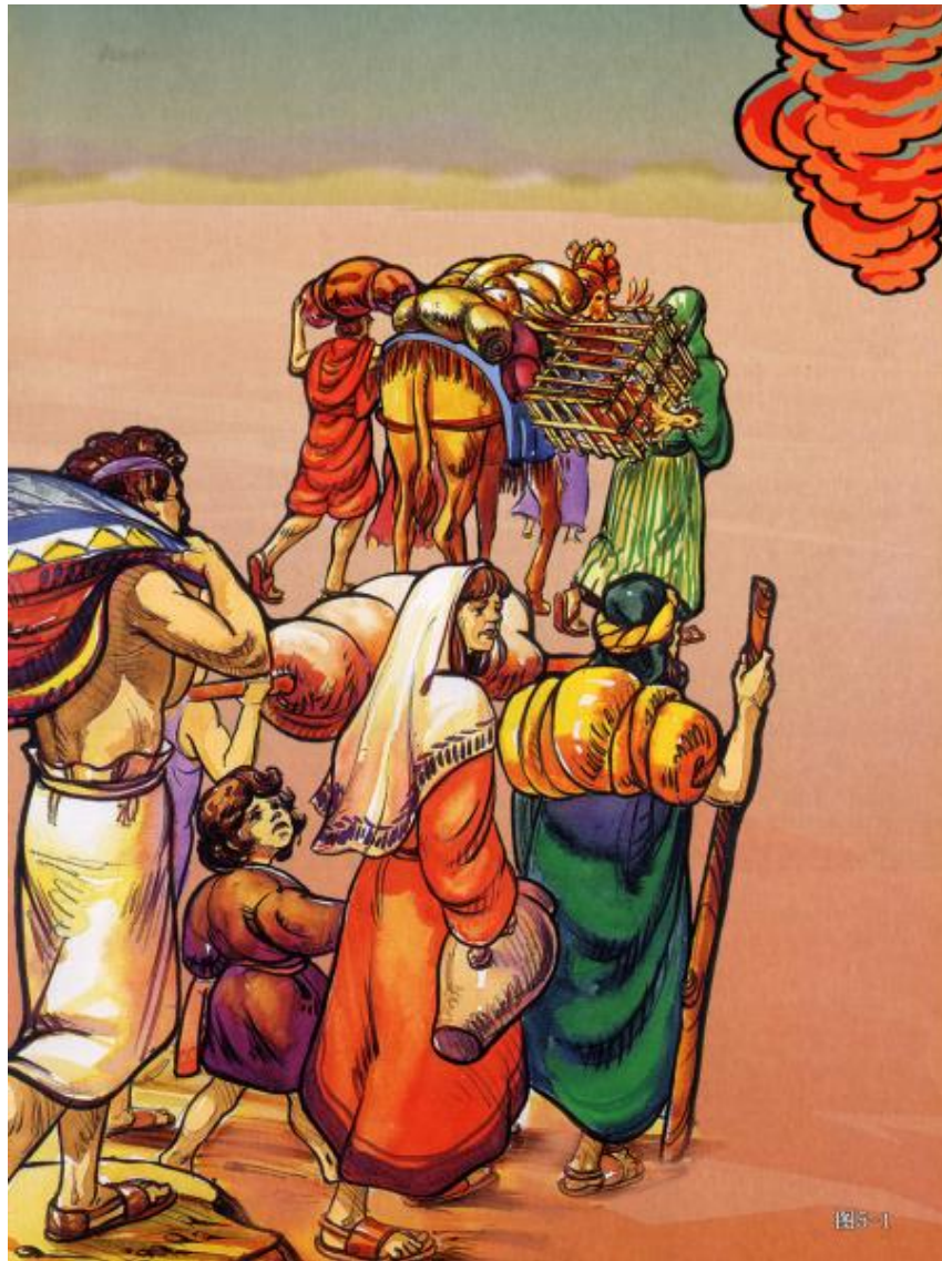
《喜乐树全人成长》第5辑第12讲：摩西（上）摩西与百姓过红海