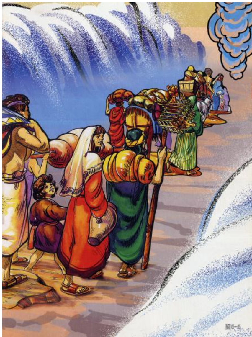
《喜乐树全人成长》第5辑第12讲：摩西（上）摩西与百姓过红海