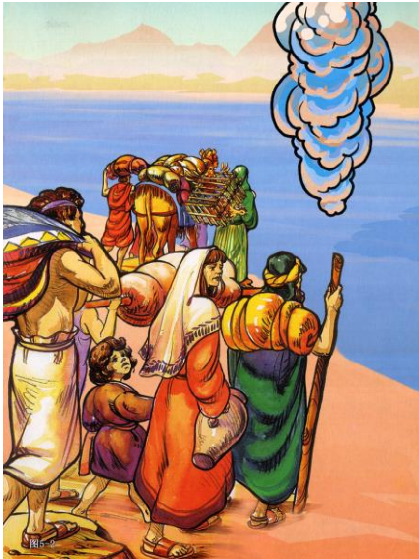
《喜乐树全人成长》第5辑第12讲：摩西（上）摩西与百姓过红海